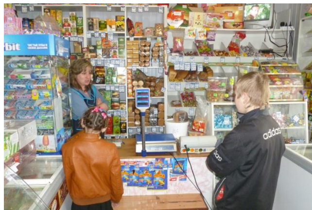
Знакомство с профессией шофера и продавца