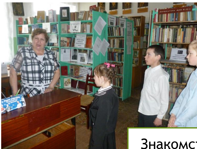
Знакомство с профессией библиотекаря